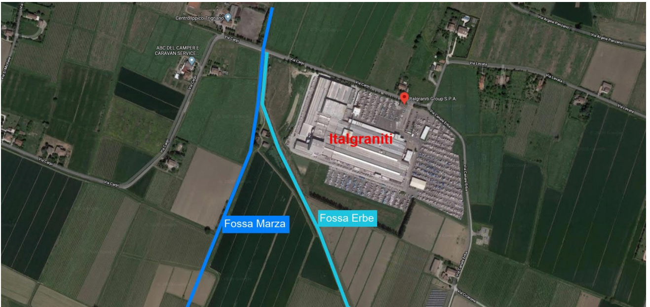
Foto 2 Inquadramento ortofoto stab. ITALGRANITI e reticolo canali in gestione Consorzio Bonifica dell'Emilia Centrale