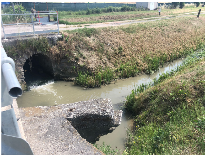
Foto 4 Sbocco Fossetta Erbe in Fossa Marza

L'area afferente al comparto della ZONA 2 , raccoglie invece le acque dei piazzali lato nord ed è pari a 24.800 mq.