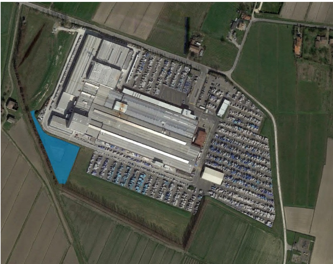
Foto 6 Area verde allagabile (bacino di laminazione ESISTENTE 1.780 mc)

Il reticolo fognario ESISTENTE del comparto ZONA 1 è costituito da condotte interrato per la raccolta delle acque meteoriche dalle caditoie dei piazzali e dai pluviali del tetto che colleghino le