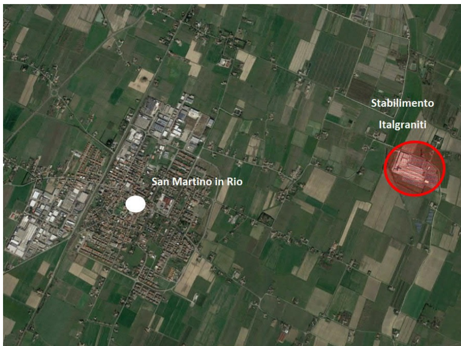
Foto 1 Inquadramento ortofoto

L'area di impianto ricade all'interno della C.T.R. n. 201061 (Trignano); confina a sud con terreni agricoli, a est con via Canale Erba, a nord con via Carpi ed infine a ovest con la Fossa delle Erbe, cavo in gestione al Consorzio di Bonifica dell'Emilia Centrale che corre parallelo in prossimità dello stabilimento alla Fossa Marza.