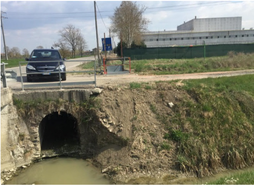
Foto 5 Sbocco Fossetta Erbe in Fossa Marza sullo sfondo stab. Italgraniti