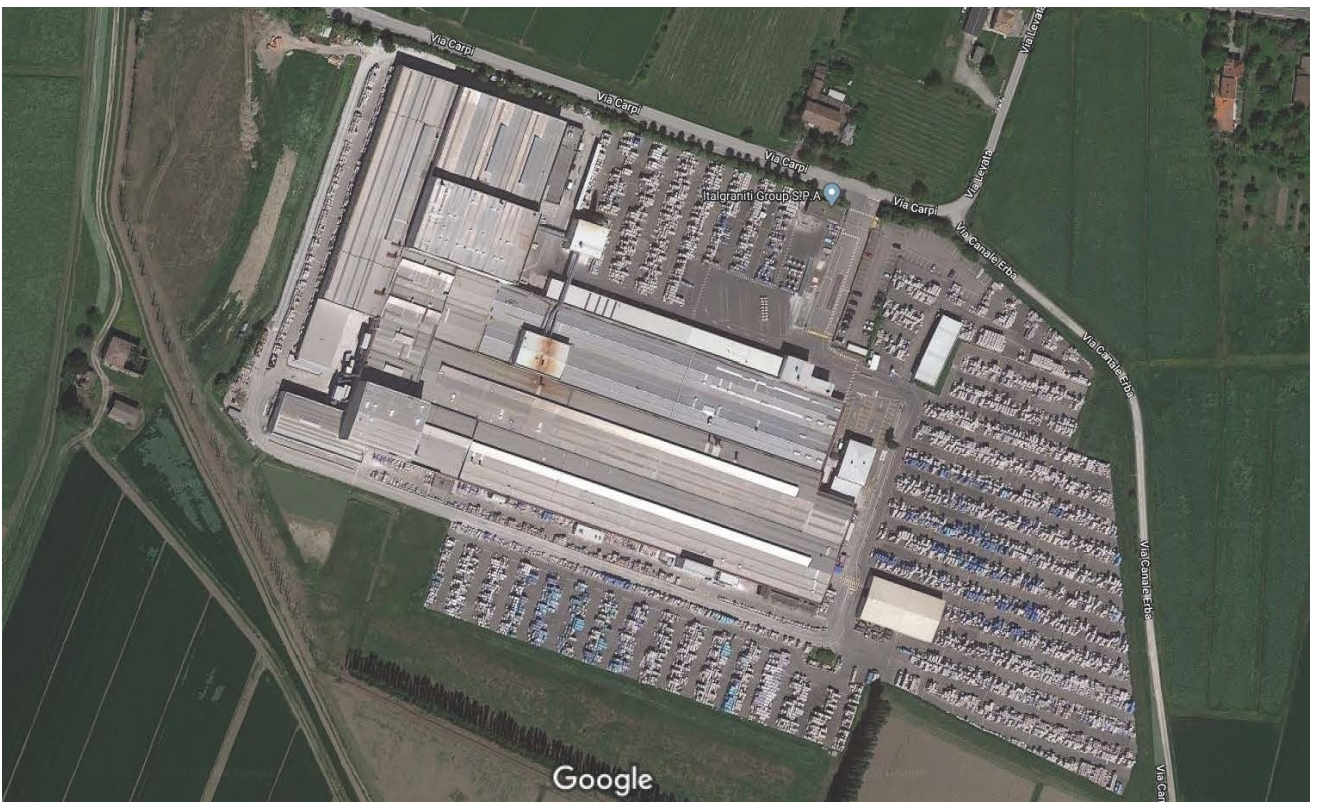
Foto 3 stabilimento ITALGRANITI