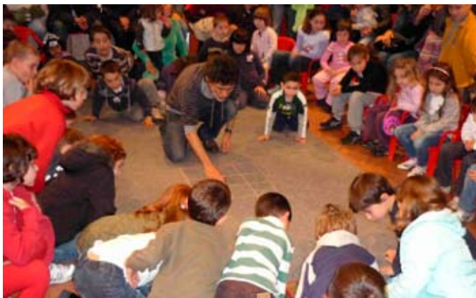
Domenica 19 aprile "A naso in su...a naso in giù: divertenti giochi in aria e a terra"

Volge ormai al termine l'iniziativa "Al Museo ci si diverte" con l'appuntamento di domenica 20 dicembre dal titolo "Fola fu-