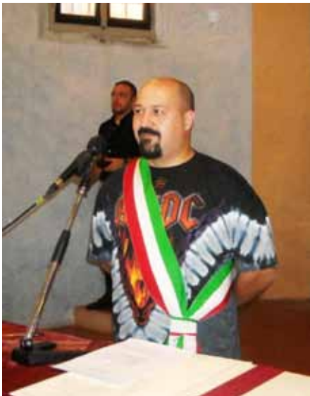
Oratorio San Rocco 8 luglio 2012