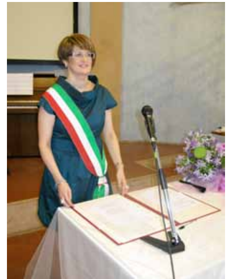
Oratorio San Rocco 14 luglio 2012