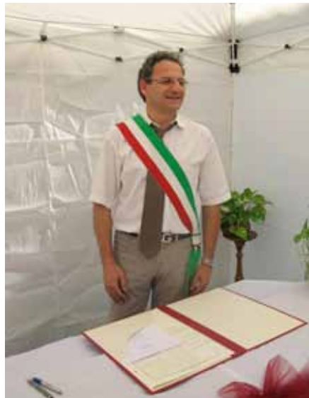
Prati della Rocca 14 luglio 2012